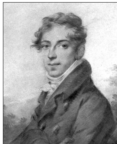
Портрет Александра Николаевича Зубова Художник А. Молинари, 1816 г.

четным членом Петербургского епархиального братства во имя Пресвятой Богородицы, ежегодно вносил 100 рублей в пользу церковно-приходских школ епархии. В особенности же благотворил он Ивановскому девичьему училищу, более 20 лет состоя в должности его попечителя. Довел училище из маленькой школы до блестящего состояния. Это училище называл он «своим детищем», благодетельная рука графа во всем здесь сказывалась и чувствовалась. Возобновление церкви при училище, учреждение лазарета, улучшение содержания служащих и детей, ежегодные награды служащим и всегдашняя отзывчивость на