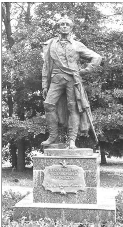
Памятник А.В. Суворову в Ульяновске (скульптор О.А. Клюев), открыт 24 ноября 2011 г.

нужды училища и служащих — все это навсегда останется в памяти лиц, причастных к сему училищу. Вся деятельность графа служила выражением не раз им высказываемой мысли: «совесть не позволила бы мне пользоваться своими средствами, если бы я не уделял части их ближним» 35 .