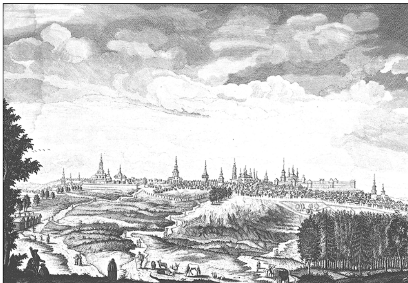
Вид города Симбирска с приезда к северо-западу Гравюра М.И. Махаева по рисункам А.И. Свечина 1769 г.

поместья получает её средний сын Платон Николаевич Зубов. К этому времени Симбирское имение заложено в Московский опекунский совет по займам 17 августа 1831 года на сумму 300 200 рублей со сроком выплаты на 37 лет 22 .