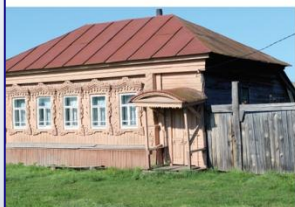
В Дурасовке много домов, украшенных резьбой

Во время Гражданской войны весной 1919 г. Барышскую Дурасовку охватил мятеж, известный как чапанное восстание (чапан – верхняя крестьянская одежда, считая из армейского сукна). В Дурасовку захватил боец продотряда, молодой новобранец. «Чапаны» схватили и убили его.