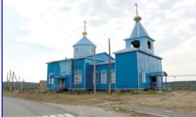
Артамоновский храм в Годяйкино

Топоним поселения образован от личного мордовского имени Гадай-ая (тегда). Сами жители о названии села говорят так: «После отмены крепостного права стали выходить из лесов и строить избы. Первым построил себе жильё дед Годай. Так постепенно застроили целое селение и назвали Годяйкино».