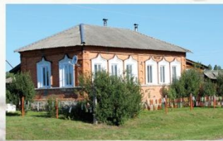
Каменный дом, Барышская Дурасовка

В просторечии и теперь еще можно слышать