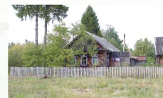
Дом в п. Дальнее Поле

Д АЛЬНЕЕ ПОЛЕ – посёлок Базарносызганского городского поселения. Расположен в 17 км к северу от районного центра в лесистой местности.