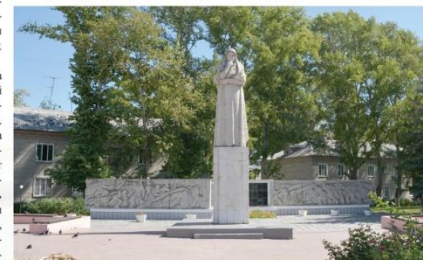
Монумент Славы и памятник Скорбящей Матери

В городе в 1964 г. установлен обелиск «Памятник революции» в честь воинов, погибших в годы Гражданской войны, памятник В.И. Ленину, а в 1976 г. открыт Монумент Славы и памятник Скорбящей Матери (архитектор С.Н. Титов, скульптор Р.А. Айрапетян), на котором 354 фамилии погибших сыновей – жителей Кремёнок. В создании Монумента Славы участвовали все заводы Новоульяновка: цементный, мягких кровельных материалов, сборного железобетона, асбестоцементных изделий, ПМК-299, ПМК-72 и др.