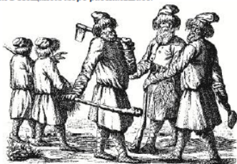
Русские крестьяне, по А. Олларико

Через несколько дён ушли они убёгом на Терек, к вольным казакам. На оставшихся корабельники купил Иван коня и всю казакскую справу, построил камышовую хатку и стал казаковать. А Матрёна, что ни год, то казаков да казачек ему рожала. Так и живёт он на Терек до сих пор, пьёт чихирь, казакам об Острове Счастья в Пешаном море рассказывает.