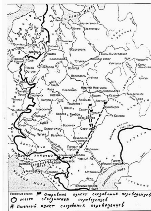
Рис. 1. Реконструкция пути симбирских переселенцев на основе переписной разборной книги конца XVII в. фонде Азовской приказной палаты Государственного архива Воронежской области (Ф. И-5. Оп. 2. Д. 72.). Реконструкция выполнена М. А. Судаковым.

(стрельцы, казаки, драгуны), в обязанность которым также был вменен присмотр за переведенцами.