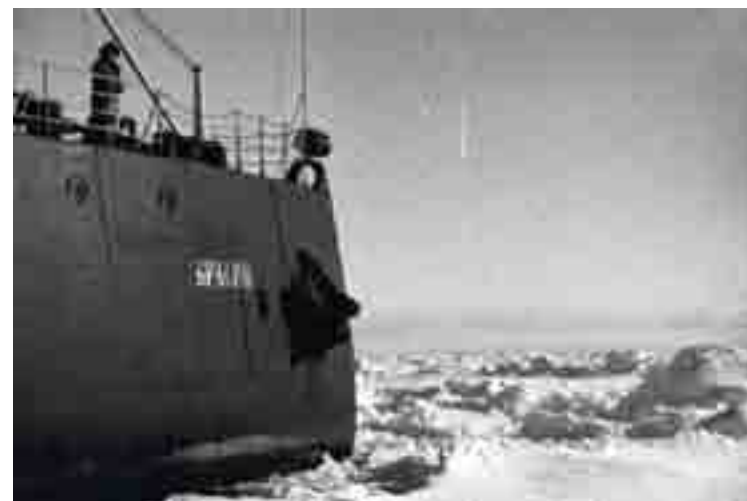
Рис. 1. Кадр из к/ф братьев Васильевых «Подвиг во льдах».