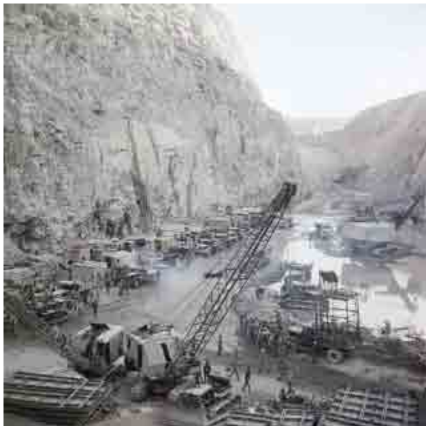
Строительство Асуанской ГЭС, 16 мая 1964 г.