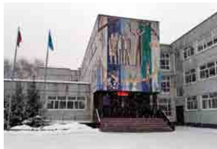
Панно на здании гимназии №24, г. Ульяновск.