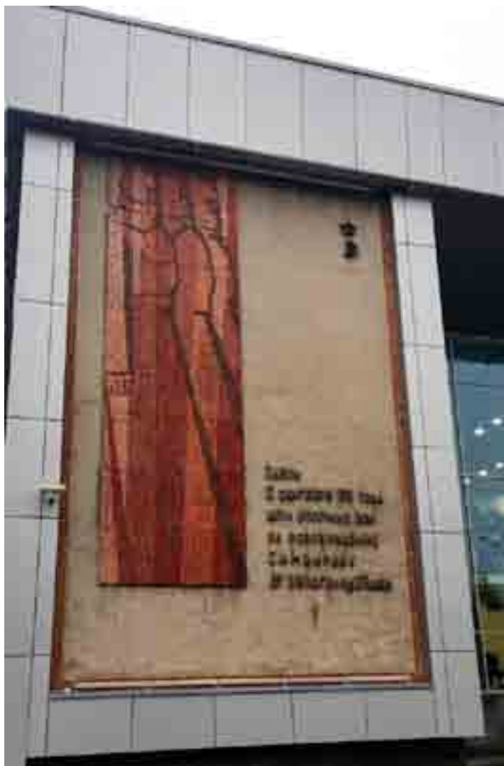
Мозаичное панно на здании железнодорожного вокзала, г. Ульяновск.