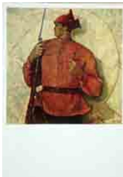
Рис. 2. Божий С.М. Красный витязь. Открытка. Советский художник, 1966.