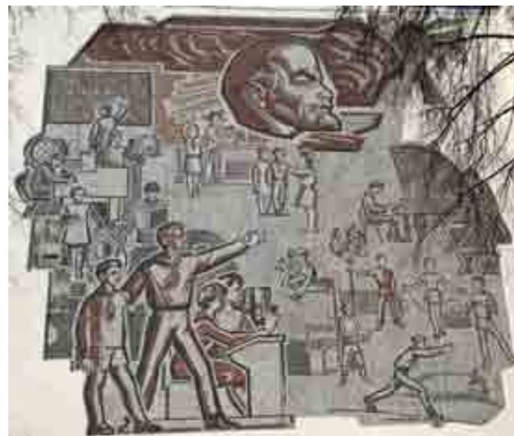
Мозаика. Гимназия №1, г. Ульяновск.