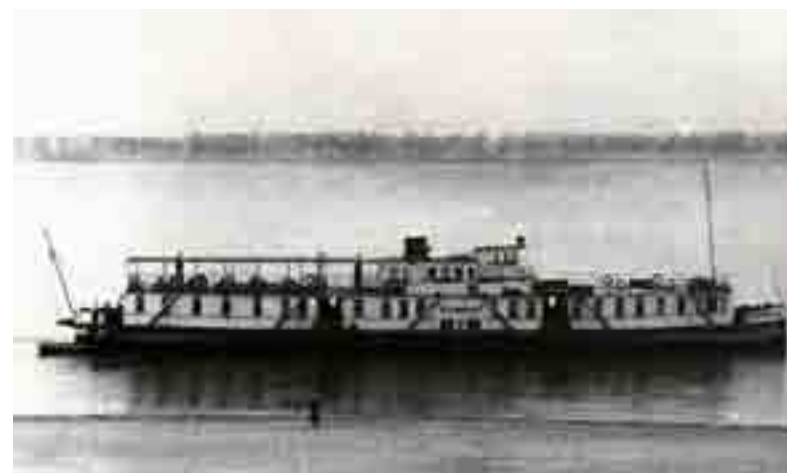
Пароход Ян Фабрициус, бывший Симбирск Баукина