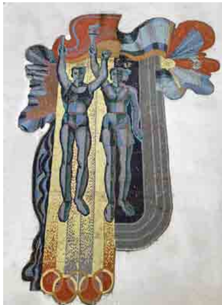
Мозаичное панно. Жилой дом по ул. Робеспьера, 120 г. Ульяновск.