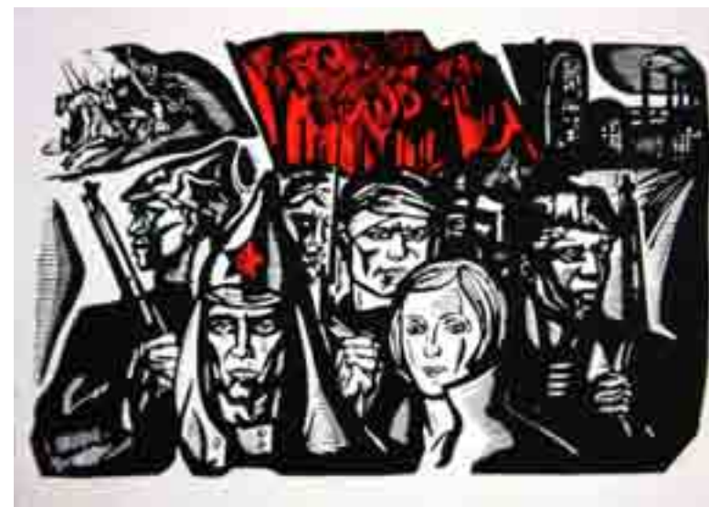
Рис. 3. Зырянов А.П. Уходили комсомольцы. Открытка. Советский художник, 1969.