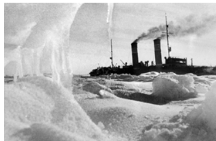
Рис. 2. Кадр из к/ф братьев Васильевых «Подвиг во льдах».