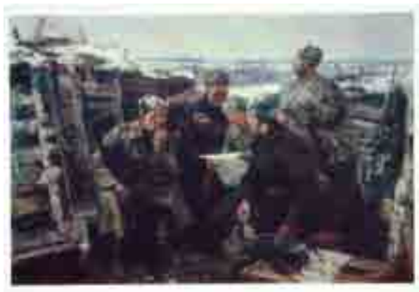
Рис. 1. Пименов В.В. Ленинское слово. Открытка. Изобразительное искусство, 1977.