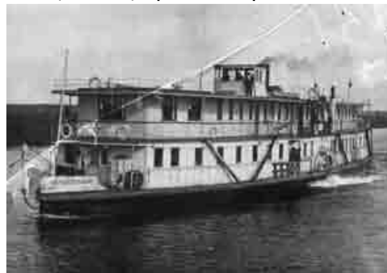
Пароход Красный текстильщик, бывший Сенгилей, 1930-е гг.

Иллюстрации к статье Т.Б. Качкиной «Национализация флота в Симбирском Поволжье»