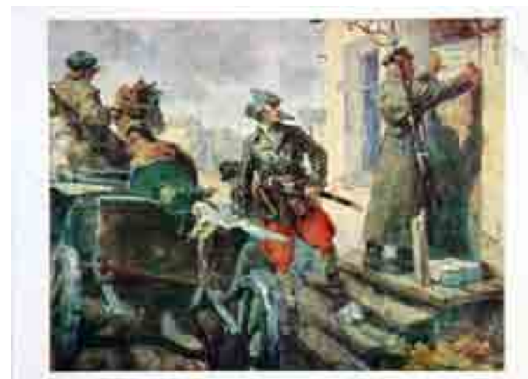
Рис. 4. Абрамов Ю.Д., Рацектаев Н.А. На фронте. Открытка. Советский художник, 1973.