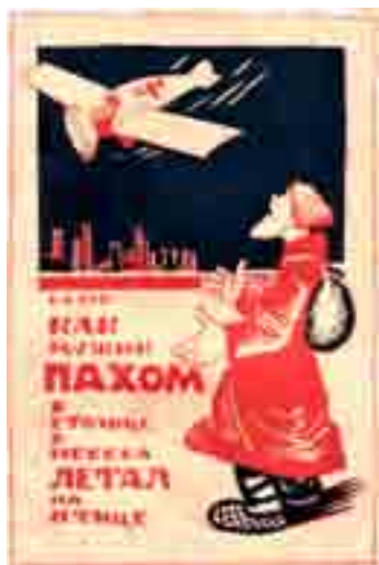
Реламный плакат. «Как мужик пахом...»

Иллюстрация к статье Е.В. Диановой «Маркеры советской действительности в отечественном кин 1920-х годов»