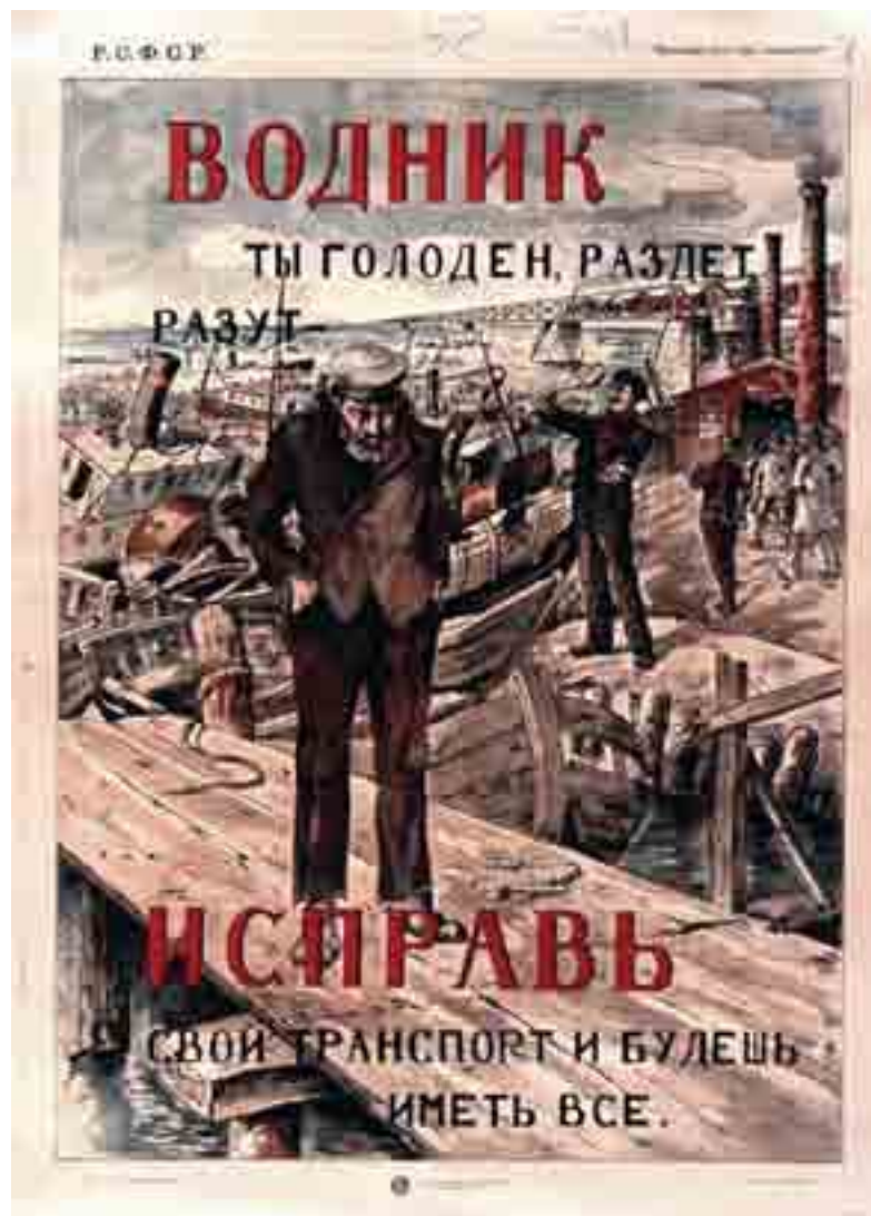
Плакат. Национализация флота.