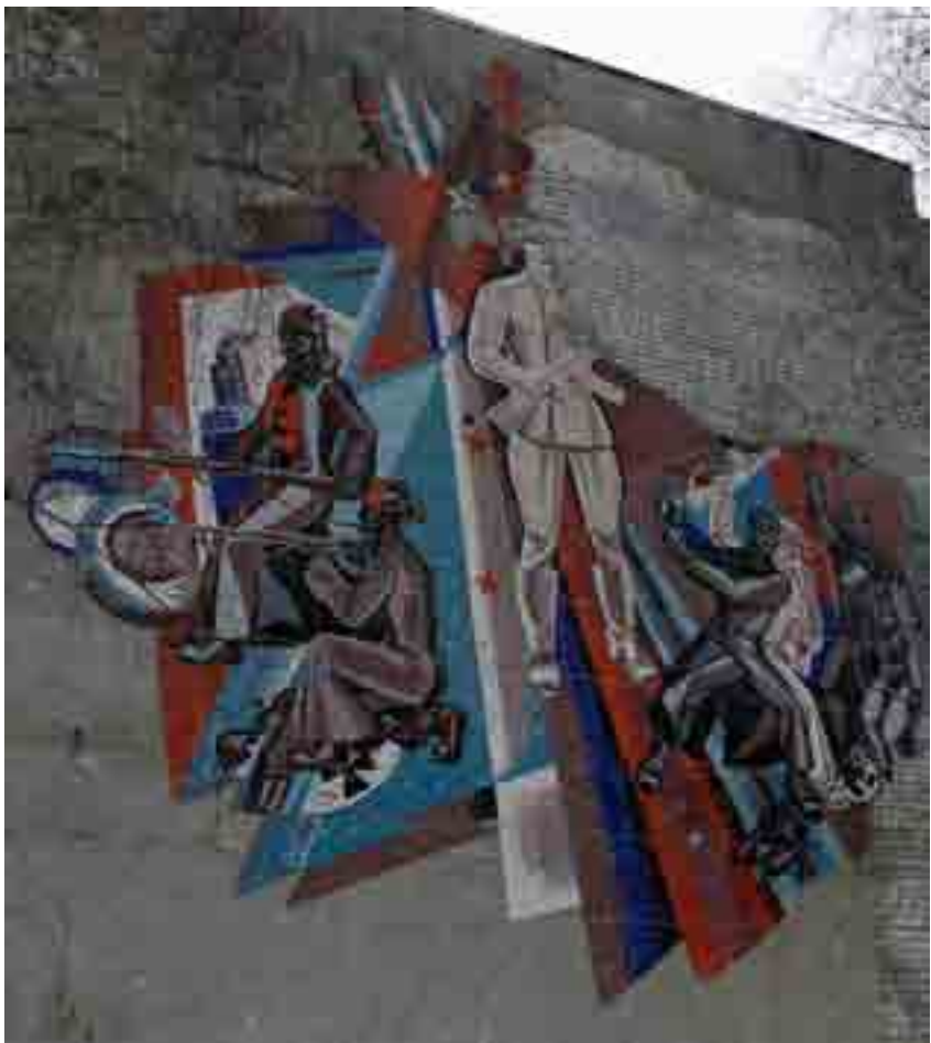
Мозаичное панно. Суворовское училище, Ул. Карла Маркса, г. Ульяновск.