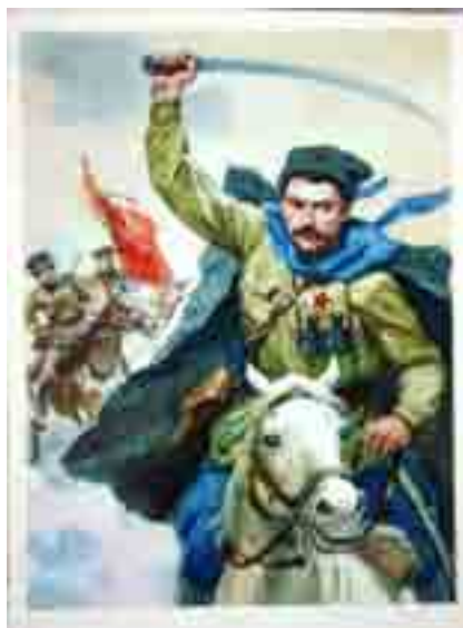
Рис. 5. Голованов Л. В.И. Чапаев Открытка. ИЗОГИЗ, 1961.