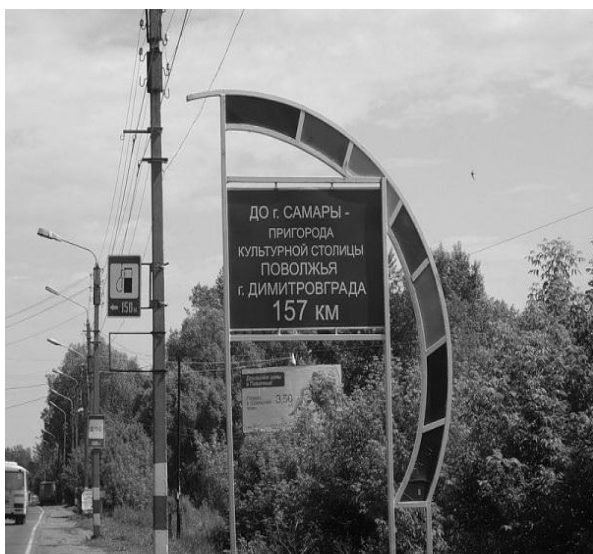
Рис.4. Знак-указатель, установленный в 2004 году в г. Димитровград

мера можно привести областные программы «Ульяновская область – здоровый регион» и разработанную летом 2017 г. концепцию внедрения интеллектуальных цифровых технологий в Ульяновской области «Умный регион» на 2017 -2030 гг.