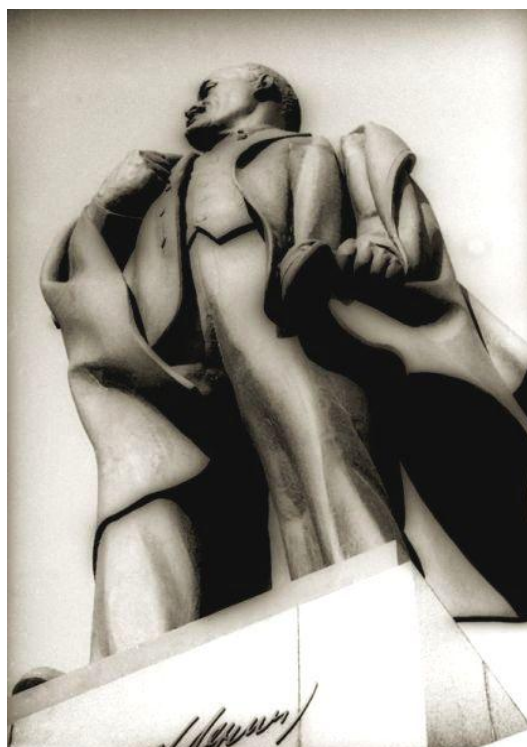
Рис. 3 Памятник Ленину. Ульяновск. 1958.

Выскажу предположение, что внутренняя противоречивость объясняет и ещё одну трансформацию словесной конструкции, которая формируется в настоящее время. Речь идёт об употреблении в СМИ слова «регион». В СМИ чаще попадают словосочетания «Ульяновский регион», «глава региона», «региональные власти», «региональные инициативы», а «Ульяновская область», «Глава области» используются в основном для официальных сообщений. И это объяснимо, на уровне профанного сознания слово «регион» звучит более весомо, чем область. Также стоит отметить и уже относительно устойчивую словесную конструкцию, сочетающую понятия «область» и «регион». В качестве при-