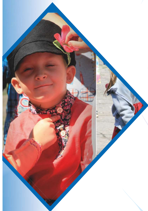
Контроль и оценка: Механизм оценки