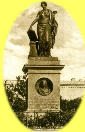
Памятник Н. М. Карамзину

К чему ни обратиться в нашей литературе—всему начало положено Карамзиным : журналистике, критике, повести-роману, повести исторической, публицизму, изучению истории.