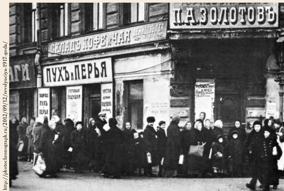
Очередь за хлебом в Москве. 1917 г.

минимум был зафиксирован в статье 4, которая определяла нормы наличного хлеба, освобождавшегося от отчуждения. Закон установил и обязанность каждого владельца хлеба сообщить продовольственным органам сведения об имевшемся у него количестве хлеба (статья 5), что должно было проверяться местными продкомитетами (статья 7). Статьи 8 — 10 требовали сдачи хлебных излишков государству по твердым ценам по принципу франко станция — пристань, т. е. без всяких надбавок за доставку. Отчуждаемый в распоряжение государства хлеб подлежал равномерному распределению среди потребителей по особым продажным ценам, устанавливаемым в соответствии с твердыми ценами в местах закупок с прибавлением необходимых накладных расходов (статья 11). Закон запрещал залог хлеба и другие подобные операции «свободной торговли» (статья 20).