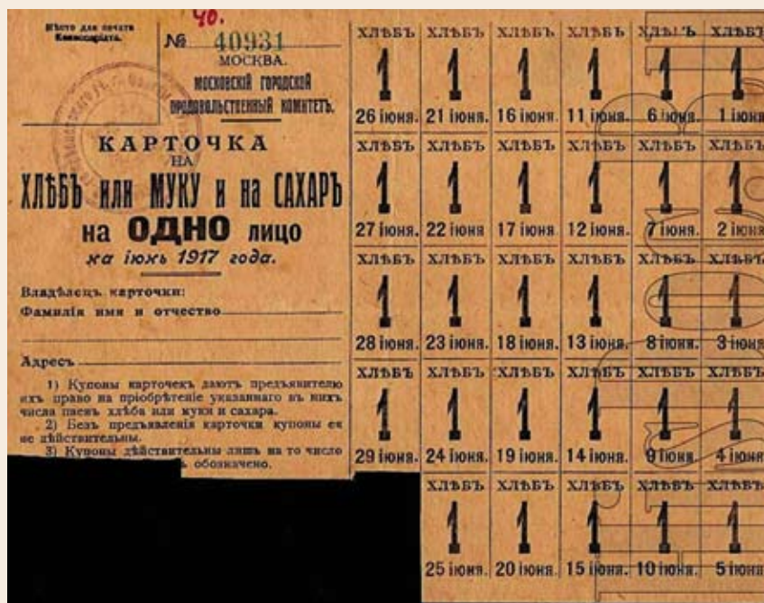
Пример продовольственной карточки г. Москвы