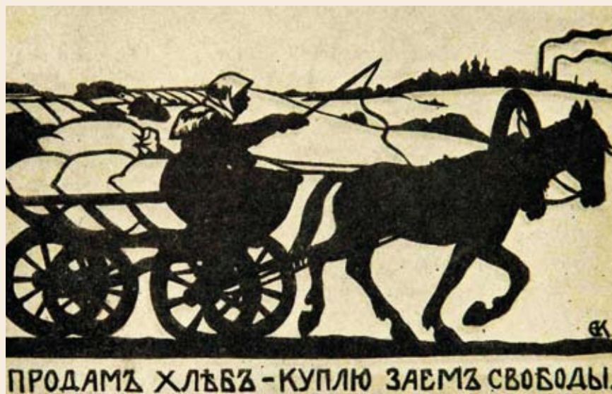
Продам хлеб — куплю заем Свободы

Постановление по Симбирской губернии демонстрирует повышение от 7 до 40 %. На галантерею, обувь, детские игрушки, овощи, фрукты,