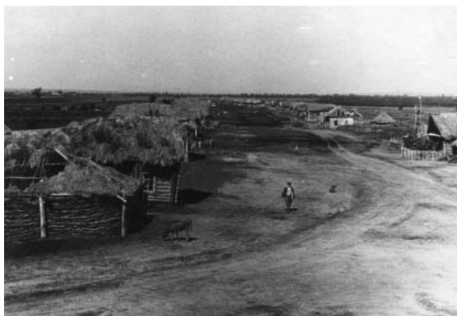
Село Кременки (экспедиция Н.П. Гриценко). 1952 г. (УКМ, и/а 22/3)

улиц и в целом развития нового населенного пункта.