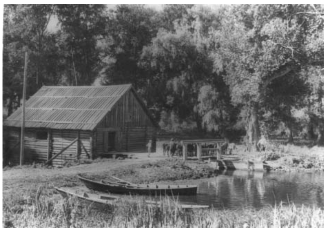
Водяная мельница в с. Тургенево (экспедиция Н.П. Гриценко). 1952 г.

как у помещиков в основе организации производства оставалось крепостничество [13, с. 3, 4]. С начала 1860-х гг. в связи с отменой крепостного права автор проанализировал устойчивую тенденцию сокращения дворянских и увеличения купеческих мануфактур.