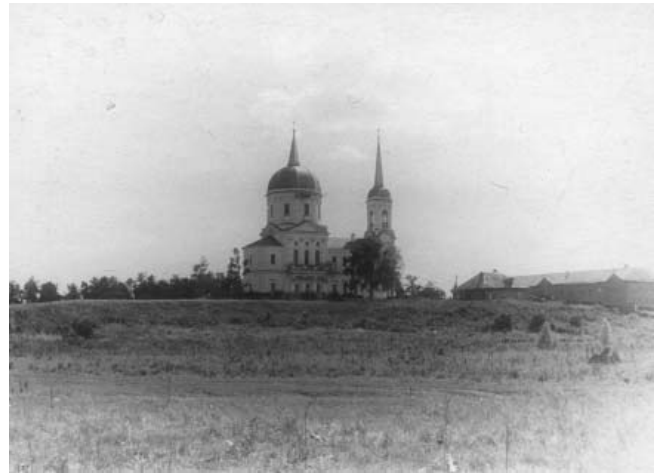
Село Головкино (вид с берега) (экспедиция Н.П. Гриценко). 1952 г. (УКМ, н/а 34/1)

Н.П. Гриценко удалось найти ценные материалы, посвященные как самому восстанию Пугачёва, так и работе А.С. Пушкина над его историей. Главным из них является хранившееся в Государственном архиве Ульяновской области первое издание «Материалов к истории пугачевского бунта», содержащее различные приложения к сочинению Пушкина: манифесты Екатерины II, указы военной коллегии, сентенция 1775 г. о казни Пугачёва, рескрипты,