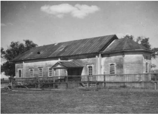
Село Тургенево. Бывшая церковь (клуб) (экспедиция Н.П. Гриценко). 1952 г. (УКМ, н/а 50/1)

по середину XIX вв., установлены данные о формах эксплуатации (барщина, оброк, их вариации) в административных границах губернии, описаны некоторые из волнений и выступлений помещичьих и удельных крестьян в XIX в. Достаточно подробно рассмотрен процесс отмены крепостного права в Симбирской губернии и его последствия для крестьянства.