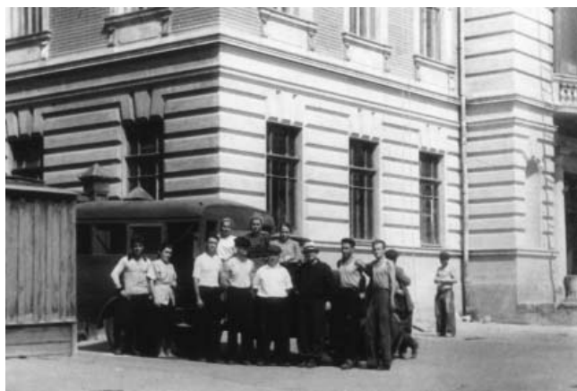
Общая фотография экспедиции Н.П. Гриценко перед выездом (около Ульяновского краеведческого музея). 1952 г. (УКМ, н/а 81/1)

разделах отражены вопросы городского благоустройства, развития образования и культуры в городской среде. Выявлены и описаны исторические памятники и достопримечательные места Симбирска–Ульяновска. Особое место среди них занимают объекты, связанные с революционными событиями и деятелями партии большевиков.