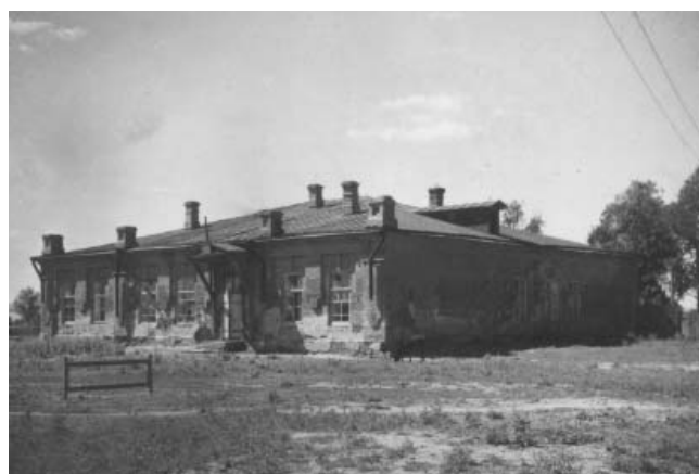
Село Тургенево. Дом декабриста Н.И. Тургенева (экспедиция Н.П. Гриценко). 1952 г. (УКМ, н/а 74/2)

Итогом многолетней работы Н.П. Гриценко над историей удельного крестьянства стала комплексная монография «Удельные крестьяне Среднего Поволжья», опубликованная в 1959 г., уже после отбытия из Ульяновска [7]. Она до сих пор остается наиболее полным и всесторонним исследованием в этой области.